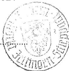
Christoph Böhm 1. Bürgermeister