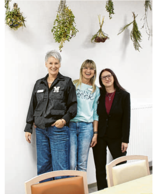
Verlässliche Begleiter durch den Tag: Das Team der Tagespflege im Gesundheitszentrum.