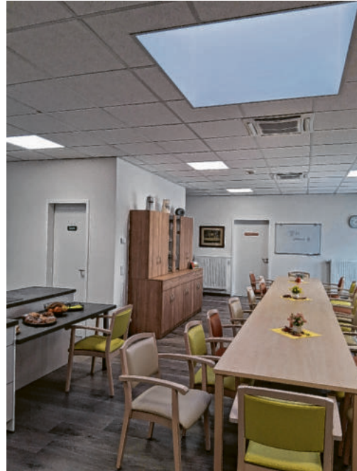
Das Herzstück der Tagespflege: Im Aufenthaltsraum stehen Gemeinschaft und Teilhabe im Mittelpunkt.