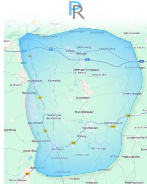
Die Karte zeigt den Einsatzbereich des ambulanten Pflegedienst im Landkreis Günzburg.