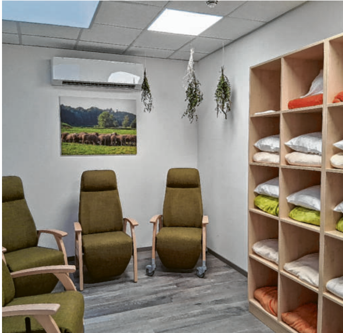
Rückzug mit Komfort: Helle, freundliche Ruheräume laden zum Entspannen und Wohlfühlen ein.