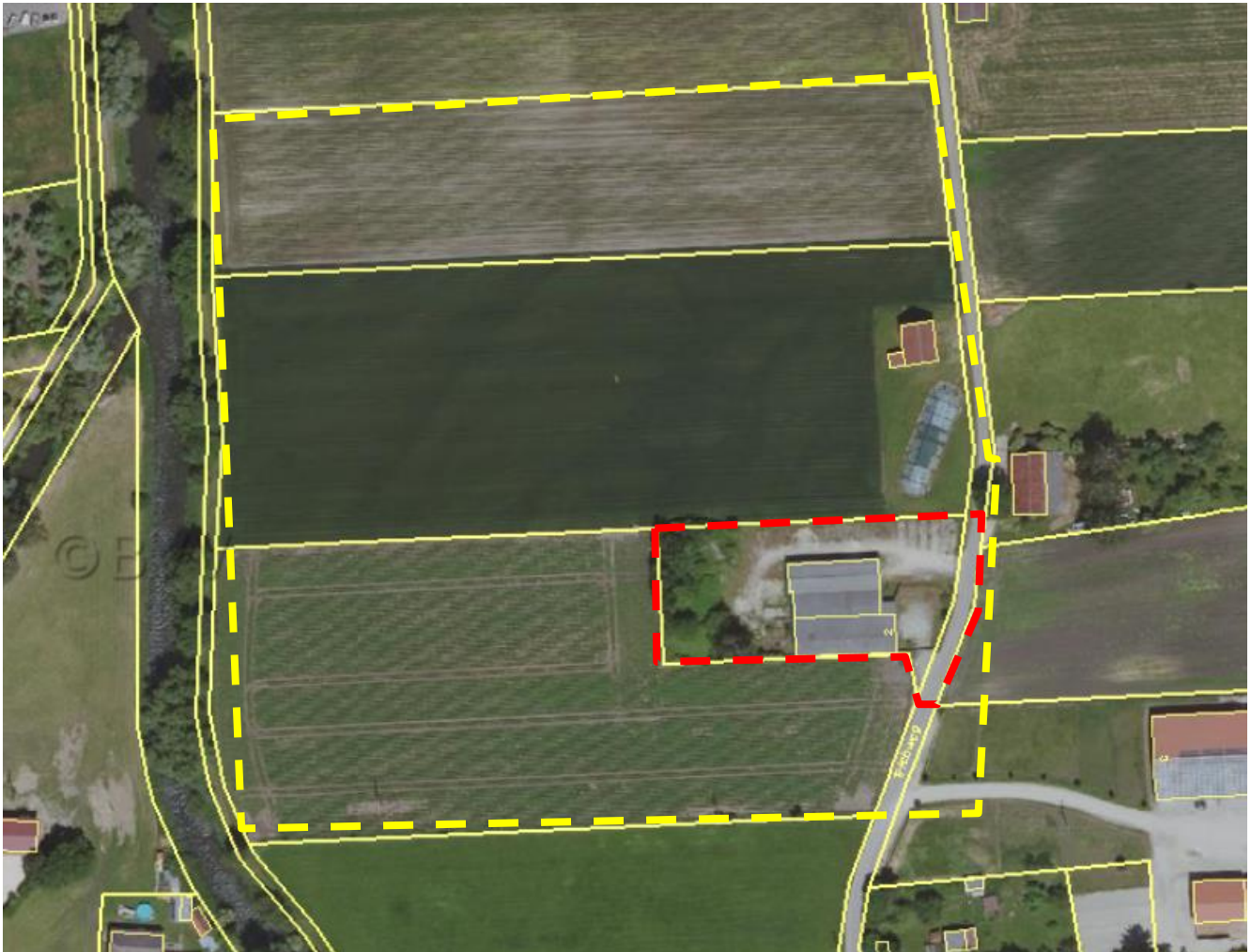
Abbildung 1: Lage der Untersuchungsfläche (Rot=Vorhabensfläche, Gelb=Feldlerche)

Das Plangebiet besteht aus Lagerhallen und einer großen Schotterfläche. Die im Luftbild noch erkennbaren Gehölze sind nicht mehr vorhanden (s. Abb.1). Die Schotterfläche weist vor allem in den Randflächen eine lückige Pionervegetation. Die Lagerhallen bleiben erhalten. Das Untersuchungsgebiet erstreckt sich auf die Vorhabensfläche sowie einem zusätzlichen Randbereich von bis zu 100 m bezüglich der Kulissenwirkung für die Feldlerche.